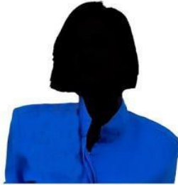
manager di un magazine sportivo