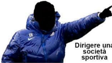
Dirigere una società sportiva