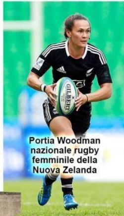
Portia Woodman nazionale rugby femminile della Nuova Zelanda