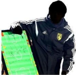
allenare una squadra di calcio