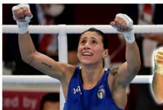
Irma Testa prima pugile italiana a vincere medaglia Olimpiadi