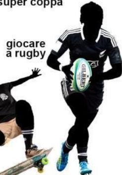
giocare a rugby