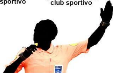
arbitrare una partita di super coppa