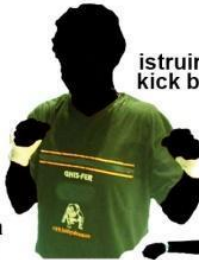
istruire alla kick boxing