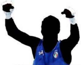
Vincere una medaglia olimpica di pugilato