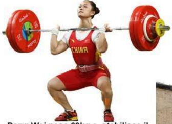
Deng Wei pesa 63kg e stabilisce il record mondiale sollevando 262 kg