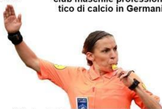
Stéphanie Frappart ha arbitrato la finale di Supercoppa Europea tra Liverpool e Chelsea