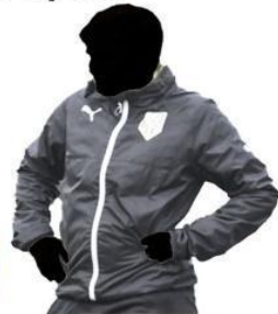
Presidente di un club sportivo