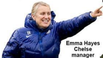
Emma Hayes Chelse manager